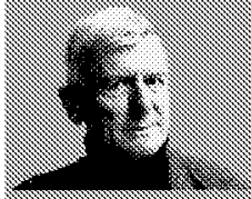
Von Hans Suter*

Polizeibeamte patrouillieren an der Bahnhofstrasse, halten Fahrradfahrer an und büssen sie. Zwar meist solche, die weder einkaufswillige Passanten und geparkte Autos der Geschäftsinhaber verunsichern oder Kinderwagen schiebende Mütter zur Seite schellen, sondern solche, die sich kaum schneller als Fussgänger fortbewegen.